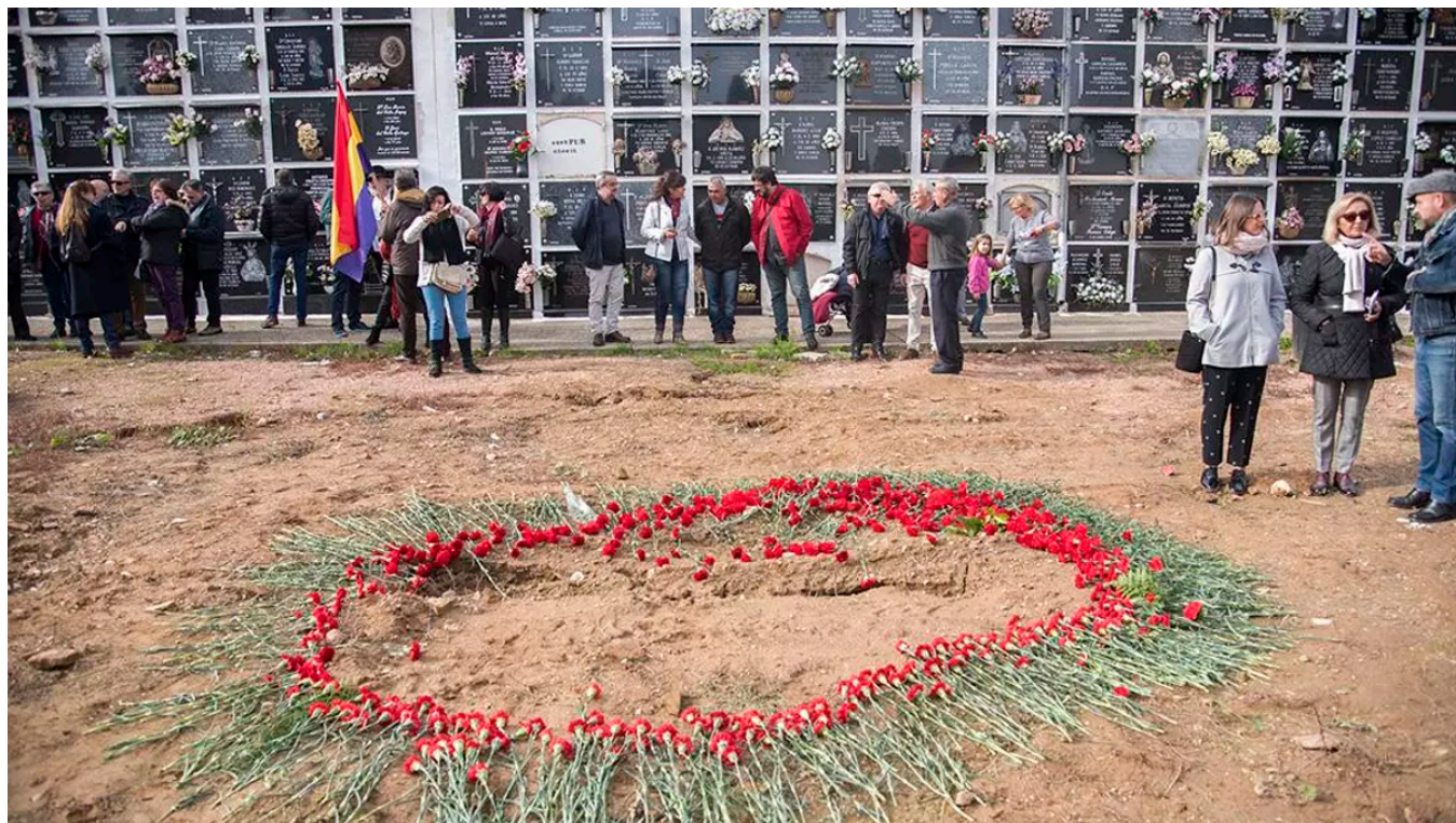
Imagen de archivo de un acto ante una fosa de represaliados en un cementerio de Córdoba.