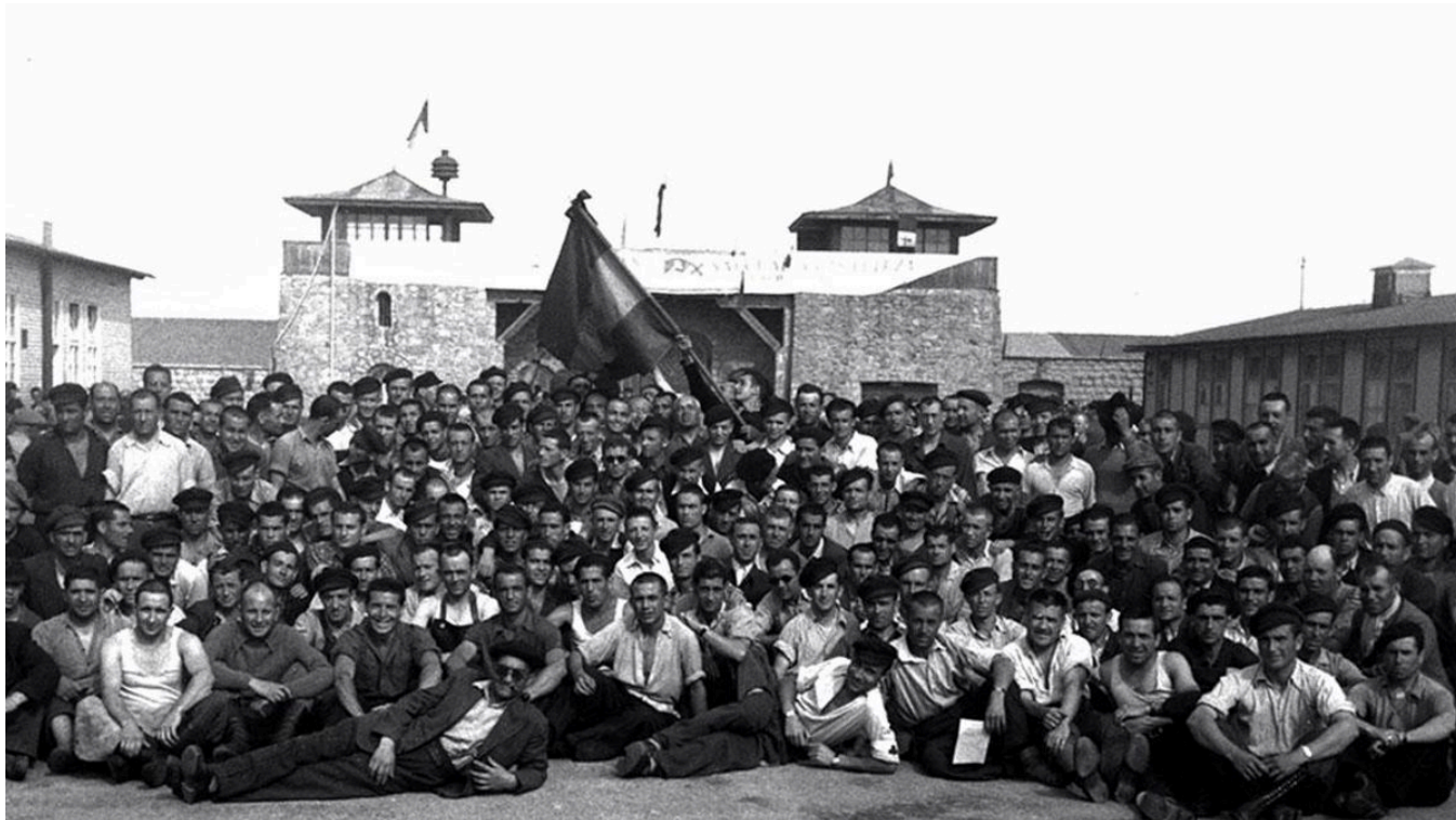
Liberación en Mauthausen