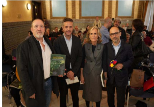
Autoridades asistentes a la inauguración de las Jornadas del pasado y,emes.

La Universidad de Córdoba acogió los días 14 y 15 de noviembre las jornadas "Córdoba en el 80 aniversario de la liberación de los campos de concentración nazis", organizadas por la Asociación Triángulo Azul Stolpersteine de Andalucía y la Cátedra de Memoria Democrática de la Universidad de Córdoba. Durante dos días, el programa combinó ponencias, proyección documental y actividad musical en torno a la memoria de las víctimas del nazismo y la deportación republicana, con especial atención a los andaluces y cordobeses.