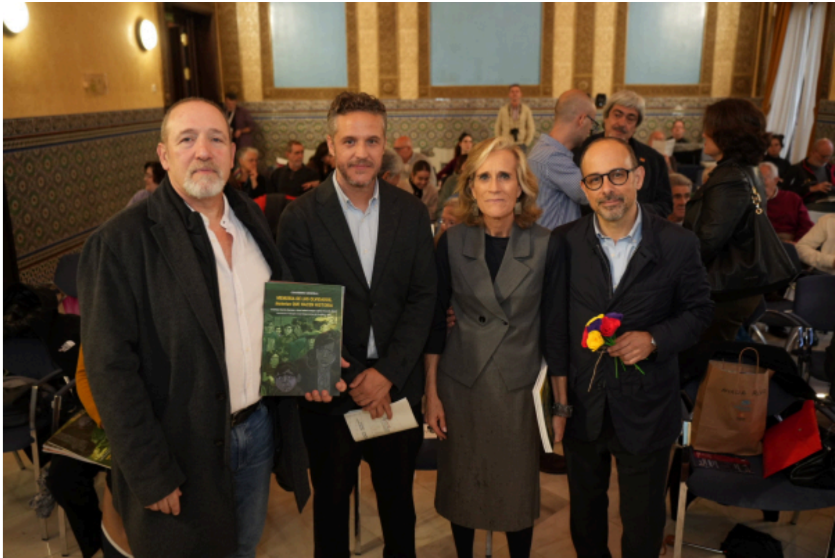
Autoridades asistentes a la inauguración de las jornadas el pasado viernes.