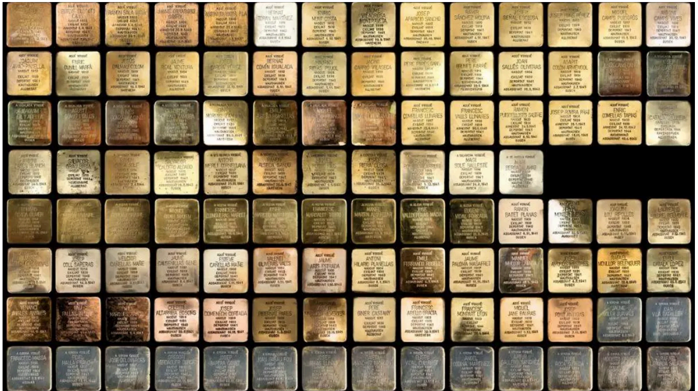
Piedras de la red internacional Stolpersteine, que recuerda a las víctimas de los campos de concentración nazis.